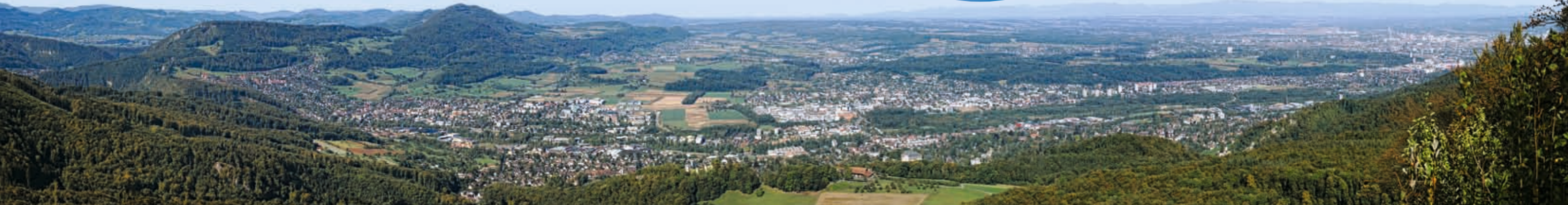
Abbildung links: ELBA umfasst ein klar definiertes Gebiet ( Planungsperimeter ), berücksichtigt aber auch die Rahmenbedingungen in einem weiteren Umfeld ( Betrachtungperimeter ), das mit dem Planungsperimeter in Wechselwirkung steht.

Die Projektleitung hat Kriterien definiert, nach denen die sechs Studienarbeiten beurteilt werden. Drei der Planungsbüros werden den Zuschlag erhalten, ihre Konzepte zu vertiefen und die Schwerpunkte aus der öffentlichen Mitwirkung darin zu berücksichtigen.